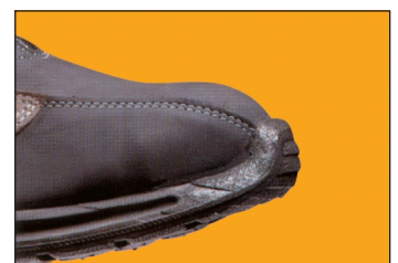
LEMAITRE ABG kapli